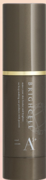
ブライセルA5+クリーム

このプログラムは、次の2つの化粧品を混ぜて毎日の夜のスキンケアとしてお使いいただくだけであり、簡単に始めることが可能です。