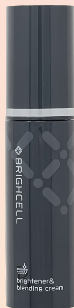
ブライセルBクリーム

「シミ予防に高い効果が期待できる美白成分である“フェニルエチルレゾルシノール”を配合した保湿クリーム」